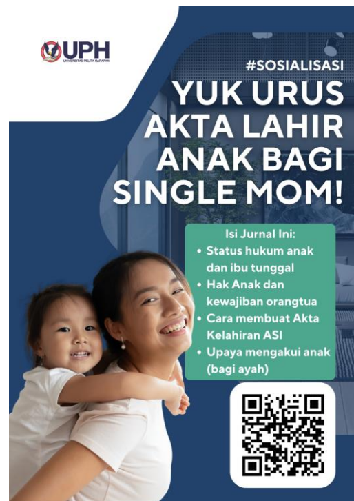
Gambar 2. Poster Sosialisasi dalam bentuk elektronik

dalam kaitannya dengan hak waris penuh dalam pembagiannya. Untuk mendukung kegiatan pengabdian ini, penulis menyiapkan poster elektronik yang dapat disebarluaskan melalui sistem elektronik untuk menjangkau masyarakat secara luas di seluruh Indonesia.