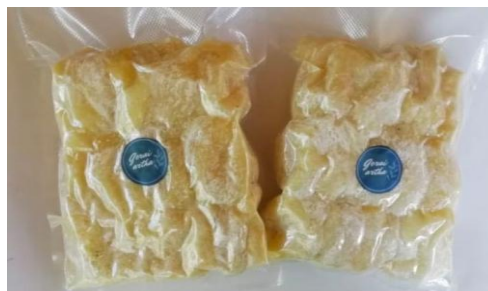
Gambar 11. Pengemasan Gembus dengan Divakum