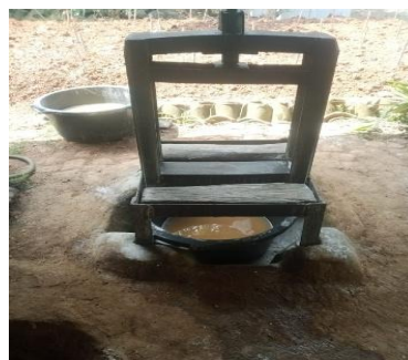
Gambar 4. Pemisahan Sari Pati Singkong Menggunakan Alat Kamplong