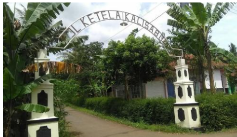
Gambar 1. Lokasi Jalan Ketela Dusun Brondong

Penelitian ini berlokasi di Jalan Ketela RT 01 RW 01 Dukuh Gandaria, Dusun Brondong, Desa Kalisabuk, Kecamatan Kesugihan, Kabupaten Cilacap, Jawa Tengah. Dusun Brondong terdiri dari satu RW dan empat RT. Semua RT pasti ada warga yang menjadi pengrajin gembus dan terbanyak ada di RT 01 karena ada 40 keluarga yang membuat gembus (Iswan, Wawancara, 19 Januari 2025). Diberi nama Jalan Ketela karena mayoritas warganya mencari nafkah dengan mengolah singkong atau ketela menjadi olahan seperti gembus, grudril, karag, dan olahan singkong lainnya, namun paling banyak yang dibuat adalah gembus.