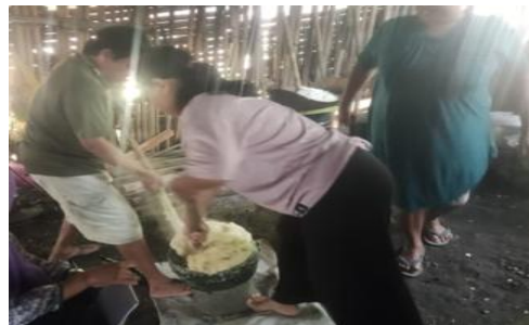
Gambar 6. Penumbukan Adonan Gembus