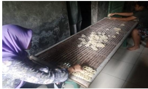
Gambar 8. Proses Menata Gembus ke Rigen