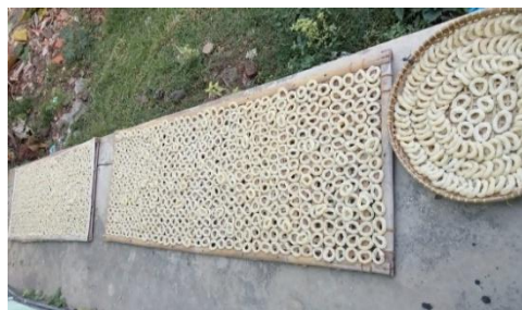
Gambar 9. Proses Penjemuran Gembus