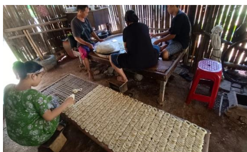
Gambar 10. Pelibatan Anak dalam Proses Pembuatan Gembus