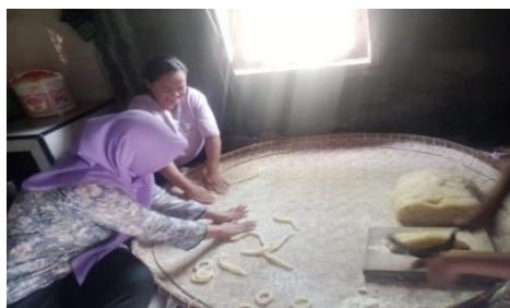
Gambar 7. Proses Menggilis-gilis Adonan Gembus