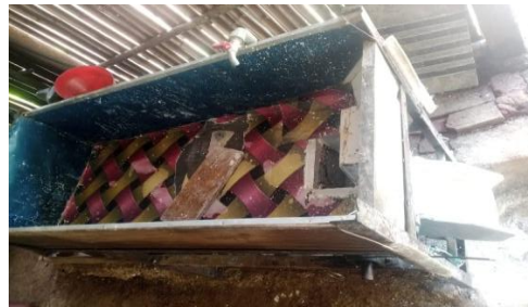
Gambar 3. Pamarutan Singkong Menggunakan Mesin Parut