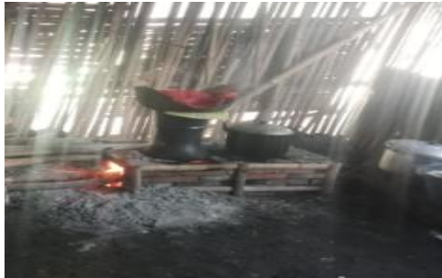
Gambar 5. Proses Pengukusan Adonan Singkong