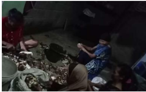
Gambar 2. Proses Pengupasan Bahan Baku Singkong