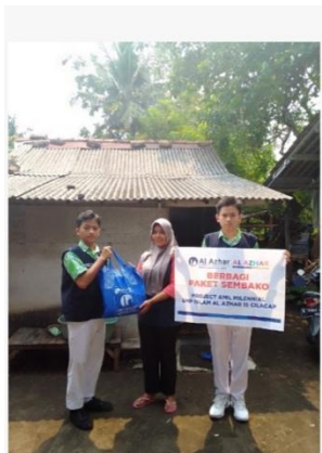
Gambar 3. Kegiatan untuk Menumbuhkan Kepedulian Sosial