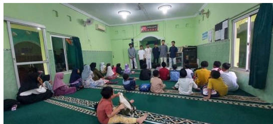
Gambar 5. Pelibatan berbagai elemen

Keterlibatan OSIS dan Ekstrakurikuler, seperti Rohis dan PMR, dalam mengorganisir kegiatan sosial. Untuk mengoptimalkan pembentukan karakter peduli sosial murid diperlukan kerjasama dengan berbagai pihak, oleh karena itu sekolah menjalin kemitraan dengan LAZ Al Azhar untuk memberikan kesempatan kepada murid untuk berperan aktif dalam mengumpulkan donasi dan menyalurkannya kepada masyarakat yang membutuhkan, Panti asuhan dan lembaga sosial yang menjadi mitra dalam melaksanakan pengabdian kepada masyarakat. Kami melibatkan semua elemen sekolah dalam kegiatan sekolah melalui berbagai cara seperti guru berperan aktif sebagai pembimbing dan mendampingi murid, sehingga guru bisa menjadi contoh yang nyata bagi murid dalam melakukan kebaikan dalam kegiatan sosial. Murid aktif dalam mengorganisir dan menjalankan program kepedulian sosial baik secara individu ataupun kelompok.