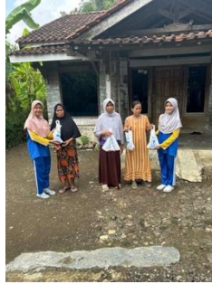
Gambar 2. Kegiatan sosial secara langsung

kurangnya waktu dan jarak tempuh ketika akan mengantarkan donasi ke tempat tujuan karena harus melalui jalan darat ataupun laut. Kalau jalur laut harus naik kapal terkadang gelombang sedang kurang bersahabat ataupun cuaca yang kurang mendukung. Ada Wilayah Cilacap yang ketika hujan sebentar dengan intensitas tinggi bisa langsung banjir, dan hanya ada satu jalur untuk menuju kesana sehingga berpengaruh terhadap distribusi donasi yang sudah terkumpul. Karena Cilacap termasuk wilayah dengan kabupaten yang luas.