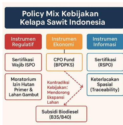
Gambar 1. Policy Mix Kebijakan Kelapa Sawit Indonesia Sumber: Diolah oleh Peneliti, 2025

Instrumen informasi juga memainkan peran penting. Upaya digitalisasi rantai pasok, termasuk ketertelusuran spasial, mulai diterapkan untuk memenuhi tuntutan pasar global. Sistem sertifikasi global seperti Roundtable on Sustainable Palm Oil (RSPO) juga semakin mendorong transparansi. Namun, harmonisasi antar-instrumen ini masih lemah. Sebagai contoh, insentif biofuel justru kontradiktif dengan tujuan moratorium hutan. Rogge dan Reichardt (2016) menjelaskan bahwa policy mix yang tidak koheren sering kali menghasilkan kontradiksi antar-instrumen. Howlett (2022) juga menekankan bahwa kebijakan yang kompleks tanpa koordinasi lintas sektor dapat memunculkan tujuan yang saling bertentangan. Untuk memvisualisasikan kompleksitas bauran kebijakan tersebut, interaksi antar-instrumen regulatif, ekonomi, dan informasi beserta potensi konfliknya disajikan pada Gambar 1 di bawah ini.