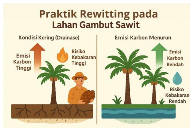
Gambar 5. Dampak Rewetting pada Lahan Gambut Sawit

Ekspansi di lahan gambut menimbulkan konsekuensi ekologis yang sangat besar. Lahan gambut tropis menyimpan cadangan karbon yang tinggi, dan ketika dikeringkan untuk perkebunan sawit, emisi karbon yang dilepaskan sangat signifikan. Novita et al. (2024) menemukan bahwa praktik rewetting atau pembasahan kembali lahan gambut mampu menurunkan emisi karbon secara substansial. Choi et al. (2024) menambahkan bahwa intervensi restorasi gambut juga dapat meningkatkan layanan ekosistem sekaligus mendukung pendapatan masyarakat lokal apabila diintegrasikan ke dalam kebijakan tata kelola lahan yang menyeluruh. Temuan tersebut menegaskan bahwa intervensi berbasis ekosistem dapat berfungsi ganda, yaitu mengurangi risiko kebakaran sekaligus menjaga produktivitas tanaman sawit. Manfaat ganda dari praktik rewetting ini diilustrasikan pada gambar berikut.