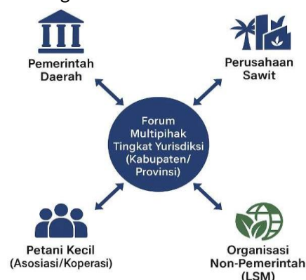
Gambar 3. Model Pendekatan Yuridiksional dan Tata Kelola Kolaboratif

Dalam beberapa tahun terakhir, pendekatan yurisdiksional muncul sebagai strategi penting untuk memperbaiki tata kelola kelapa sawit berkelanjutan di Indonesia. Pendekatan ini berfokus pada level kabupaten atau provinsi, di mana berbagai aktor, pemerintah daerah, perusahaan, petani kecil, dan organisasi non-pemerintah dilibatkan dalam forum multipihak untuk menyelaraskan kebijakan penggunaan lahan dengan standar keberlanjutan global. Struktur interaksi dalam forum multipihak ini dapat digambarkan sebagai berikut.