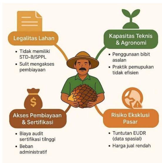
Gambar 2. Hambatan Struktural Petani Kecil

Hambatan pertama adalah legalitas lahan. Banyak petani mandiri tidak memiliki dokumen resmi seperti Surat Tanda Daftar Budidaya (STD-B) atau Surat Pernyataan Pengelolaan Lingkungan (SPPL). De Vos et al. (2023) menunjukkan bahwa ketiadaan dokumen legal ini membuat petani sulit mengakses program sertifikasi maupun pembiayaan formal.