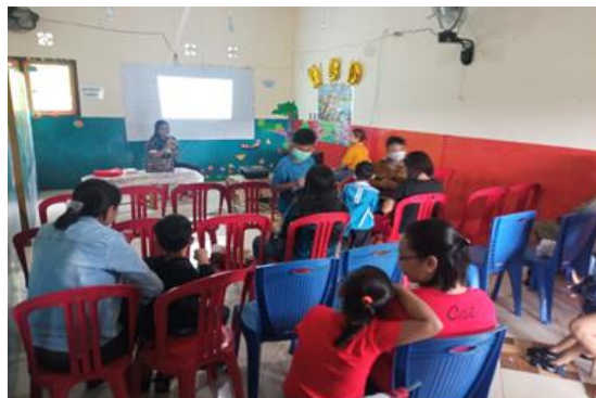
Gambar 2. Penyampaian Materi Gadget dan Pengaruhnya bagi anak-anak

Kegiatan pengabdian masyarakat ini berfokus pada edukasi kepada orang tua terkait pengaruh gadget pada anak. Kegiatan pengabdian masyarakat ini dilakukan secara langsung berinteraksi dengan peserta dengan tetap menerapkan protocol Kesehatan. Peserta yang mengikuti kegiatan berjumlah 25 orang.