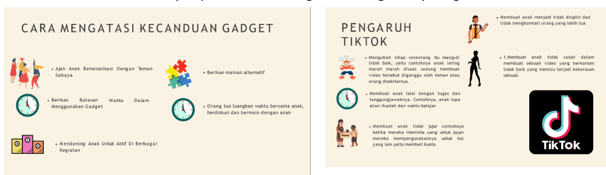
Gambar.3 Materi terkait Gadget dan Pengaruhnya